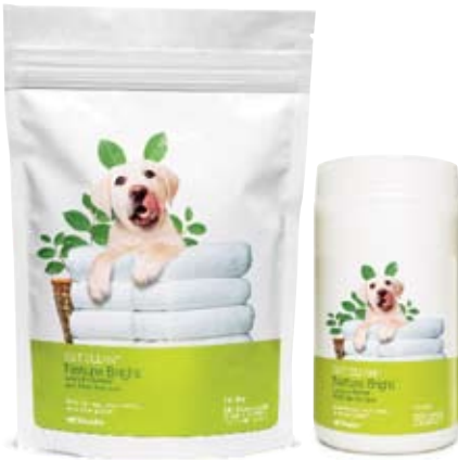
Bolsa de 32 oz.